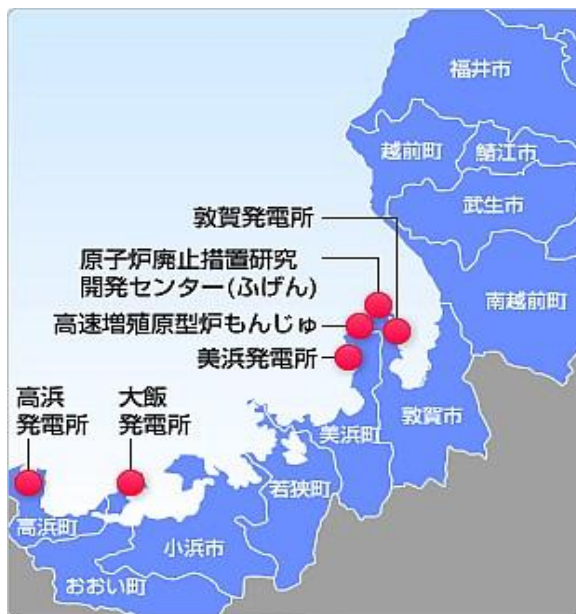
福井原発群

周辺の稜線沿いや山腹に巨大風車が林立し、四六時中、回転しているわが小村——グロテスクな世紀末風景だ。精神的圧迫、低周波振動による健康障害など、とてもじゃないが、こんな村には住めない。