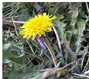
■初春の花(特に名を秘す)／タンポポ