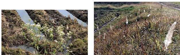
■野菊のような花(晩秋の花か?)／名称?(秋に多い)