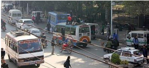
■ラトナ公園バス停

ネパールは、新憲法の下でも、依然として「社会主義」国家である。グローバル資本主義化の下で、新生ネパールがこれから先、社会主義の観点からどこまで経済活動を統制するか、難しい選択である。