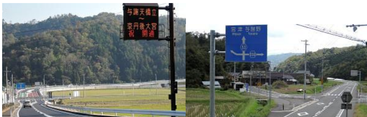
■完成したインター出口／数キロ先の新設「久住バイパス」

また、米軍の軍人・軍属の皆さんの車利用も大歓迎。高速道路のこの付近の制限時速は 70km(!)だし、取り付け道路にはまだ曲がりくねった狭い旧道もあちこちにあるが、これもどうということはない。住民自身がよく注意しておれば、それで済むことだから。