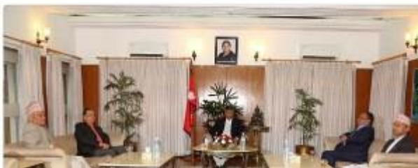
■プラチャンダ前首相らと会見するデウバ首相

Sher Bahadur Deuba @PM_Nepal · 8月19日 Meeting with ex-Prime Ministers. Thank you all for your invaluable input. ● 英語から翻訳