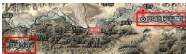
■シガツェ和平空港～シガツェ市(Google)

中国が、チベットからネパールに向けての交通インフラ建設を加速させている。9月15日には、シガツェ和平空港(軍民共用)からシガツェ市内までの高規格道路が完成した。ラサからシガツェに至る G318 号線の一部で幅員 25m, イザというときには軍用機の離発着が可能だそうだ。