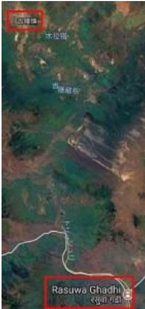
■吉隆鎮～ラスワがディ(Google)

ネパールなどを「衛星国家」と呼ぶのはいささか言いすぎだが、「一帯一路」の旗を翻し、着々と南下する中国をインドが警戒するのは当然といえよう。