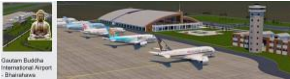
■ゴータマ・ブッダ空港 FB