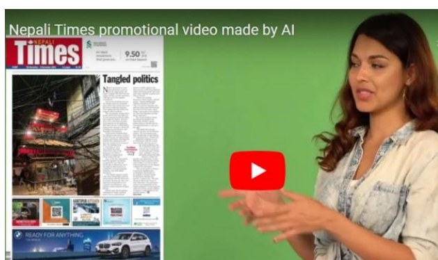
■AI 作成「宣伝ビデオ」( Youtube / Twitter ) 谷川昌幸(C)