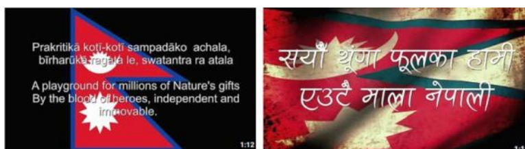
■ ネパール国歌 YouTube