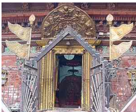
■寺院の三角旗(筆者撮影 2009)