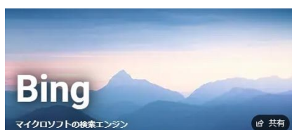
■ 日本語新バージョン Bing