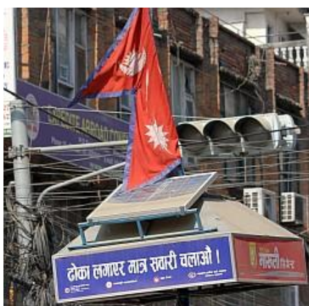
■「国旗」と旧市街・信号機・太陽光発電・警察