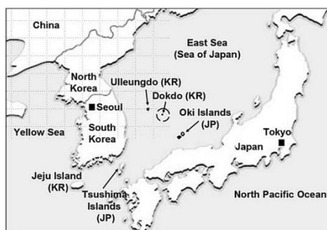
Map of Dokdo-Takeshima